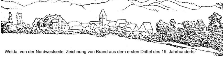
Welda, von der Nordwestseite; Zeichnung von Brand aus dem ersten Drittel des 19. Jahrhunderts

Die fünfte Ausgabe vom Juni 1989 widmet sich dem Weldaer Gemeindehaushalt im Jahr 1684 sowie den Einquartierungen im Spanischen Erbfolgekrieg 1701 – 1714