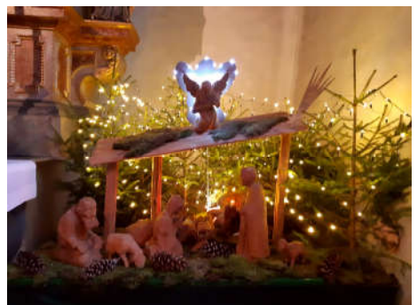
24 - St. Kiliankirche