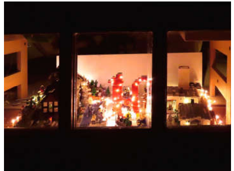
10 - Familie Bodemann