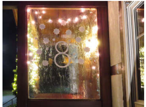
8 - Familie Lücke