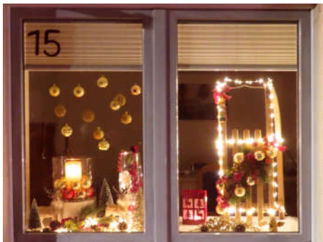
15 - Familie Winkler