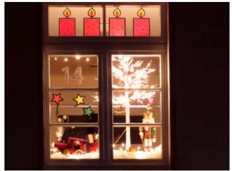
14 - köb - Bücherei