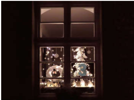
3 - Familie Lücke