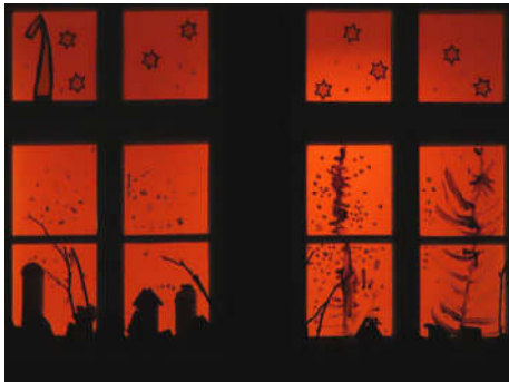
1 – Kindergarten