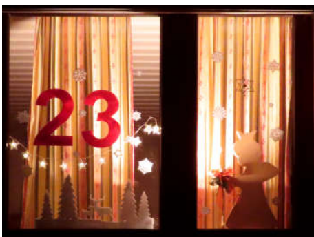
23 - Familie Temme