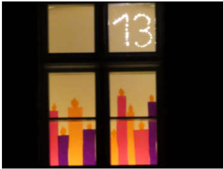
13 - Familie Drude