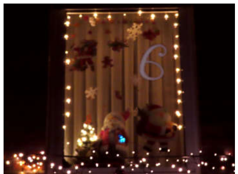
6 - Familie Lange / Petry