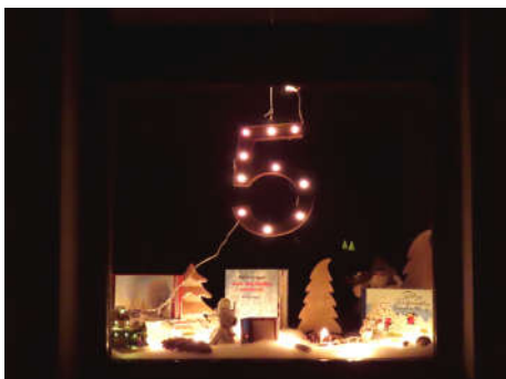
5 - Familie Kuhaupt