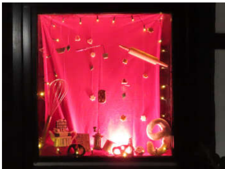
9 – Lars Ulrich