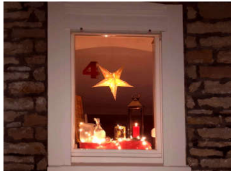
4 - Familie Hillebrand