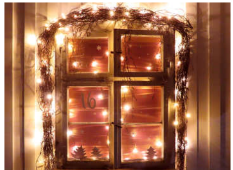
16 - Familie Baltes-Tegethoff