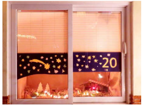
20 - Familie Drude-Kampczyk