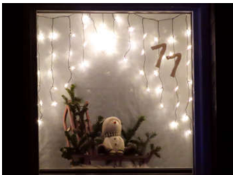
11 - Familie Rechau