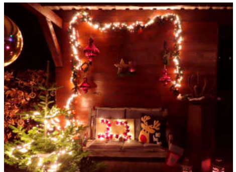
22 - Familie Blume