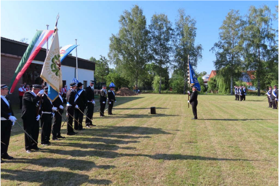
Befehlsübergabe der Obristen auf dem Festplatz