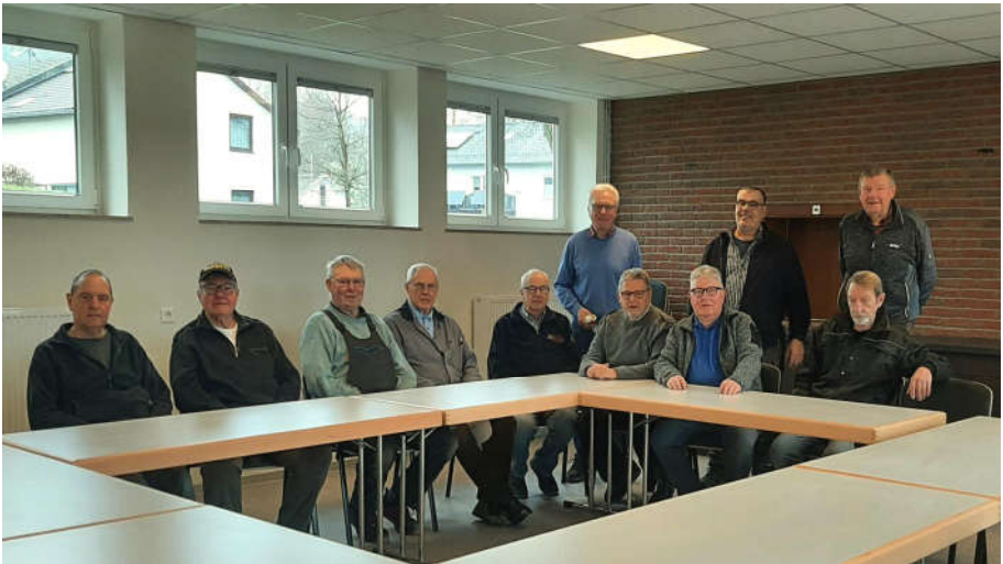
Die Rentner AG nach getaner Arbeit im neuen Mehrzweckraum der Iberg-Halle

Vielen Dank für die Unterstützung und die gute Arbeit der fleißigen Helfer der Rentner AG