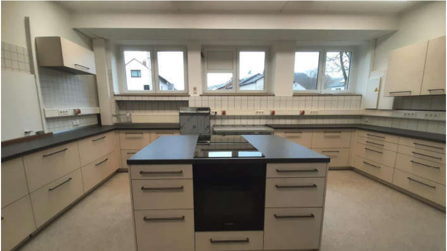
Die neue Einbauküche der Iberg-Halle